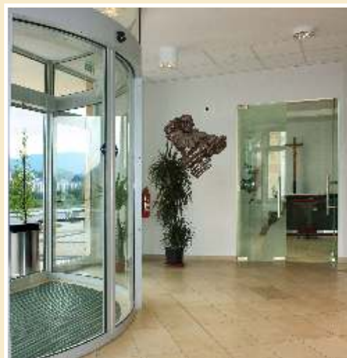
Obr.: Moyses v Banské Bystrici.