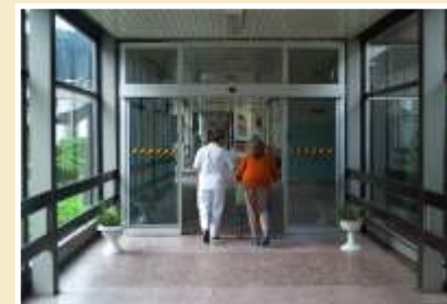
Obr.: realizace z Domovů důchodců v Hranicích na Moravě a v Podlesí.