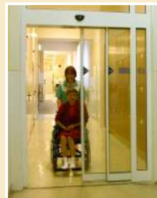
Teleskopická konstrukce automatických dveří vytváří širší průchozí prostor dveří.