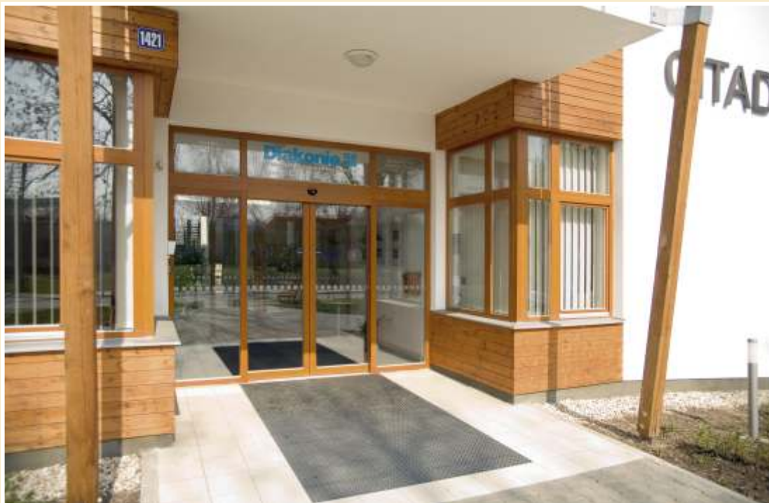
Obr.: CITADELA - DIAKONIE Valašské Meziříčí - dva vstupní portály s automatickými dveřmi, mezi nimi zádveří s čistící zónou. Portály i automatické dveře jsou vizuálně přizpůsobeny fasádě a oknům.