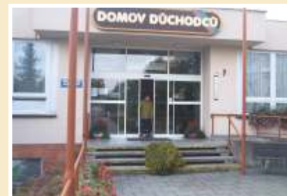
Standardní provedení dvoukřídlových posuvných automatických dveří ve vstupním portálu (prosklené pevné boční díly + nadsvětlíky), vyrobené z hliníkových profilů a bezpečnostního skla.