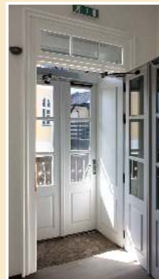
Automatické dveře s otočným pohonem - vhodné do památkově chráněných objektů;