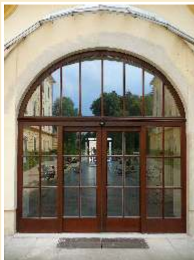
Obr.: Diakonie Myslbořice